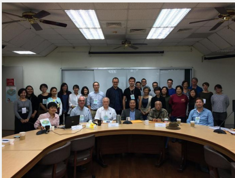
2016年「南島世界中的階序與平權」研討會INTERNATIONAL CONFERENCE ON HIERARCHY AND EGALITARIANISM IN AUSTRONESIA/OCEANIA 活動照片