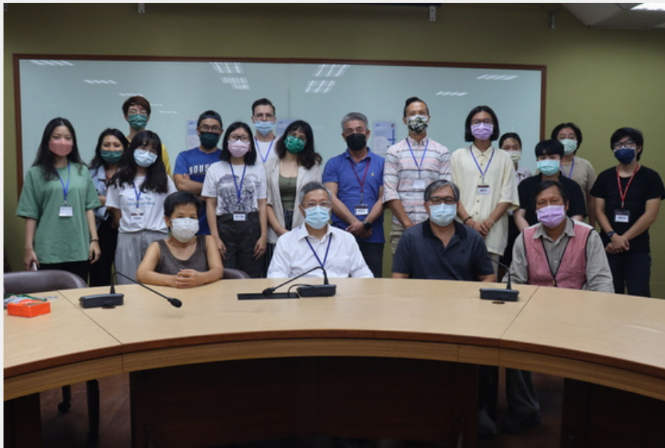
2021世界南島暨原住民族研究分享會 活動照片