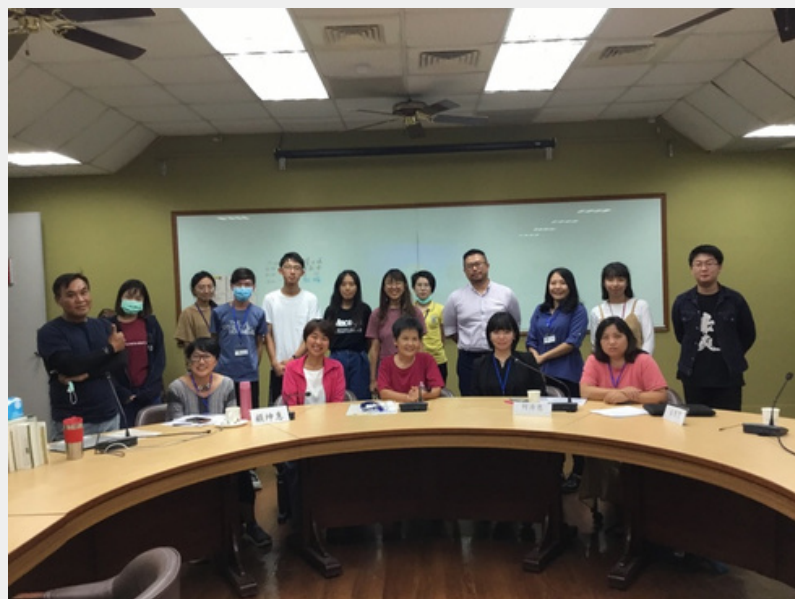
2020 公共人類學工作坊 活動照片