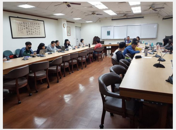
2018年「實踐與展望：原住民族文學與教育」工作坊 活動照片