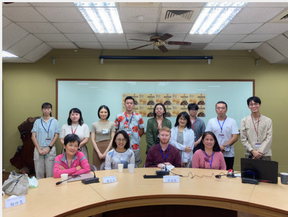
2022南島中心教學工作坊及跨領域學分學程說明會 活動照片