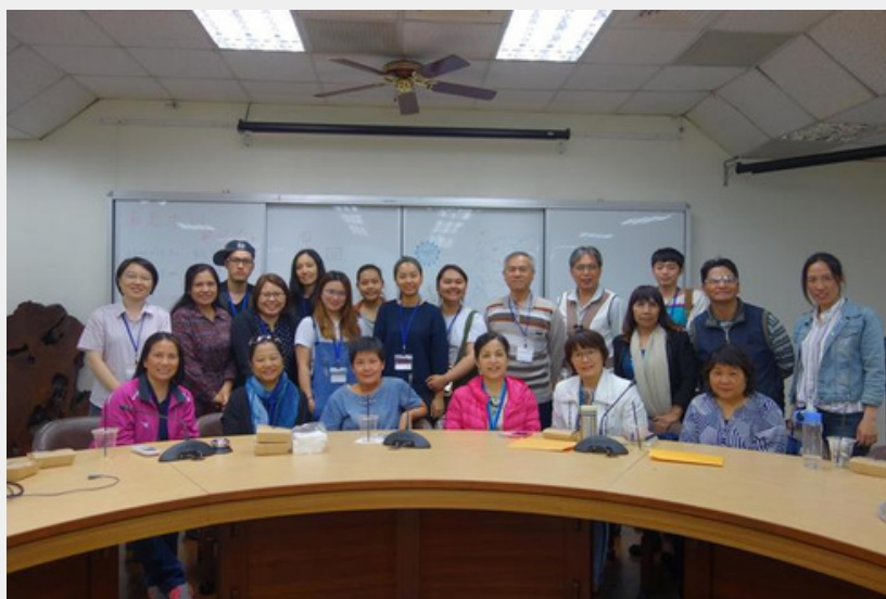
2017 原民校友回娘家 活動照片