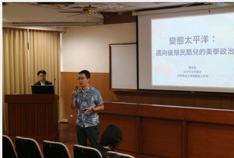
2019 世界南島文學與藝術工作坊 活動照片